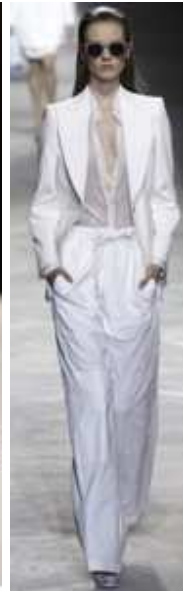
DRIES VAN NOTEN