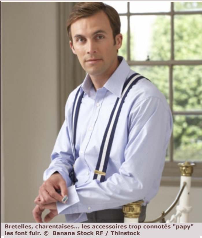
Bretelles, charentaises... les accessoires trop connotés "papy" les font fuir.