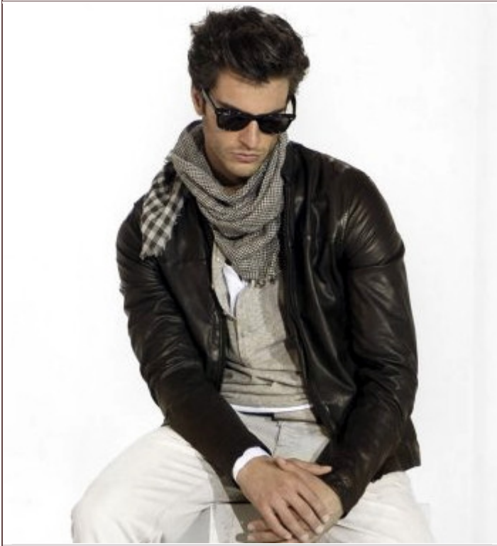
Un homme qui soigne son look est un homme qui veut séduire. Tenue printemps/été 2010 de IKKS Men.

Nous avons mené une enquête auprès des lectrices du Journal des Femmes afin de connaître leurs goûts en matière de garde-robe masculine. Qu'est-ce qui les attire ? Aiment-elles que leurs hommes soient bien habillés et, surtout, comment ? Voici leur réponse.