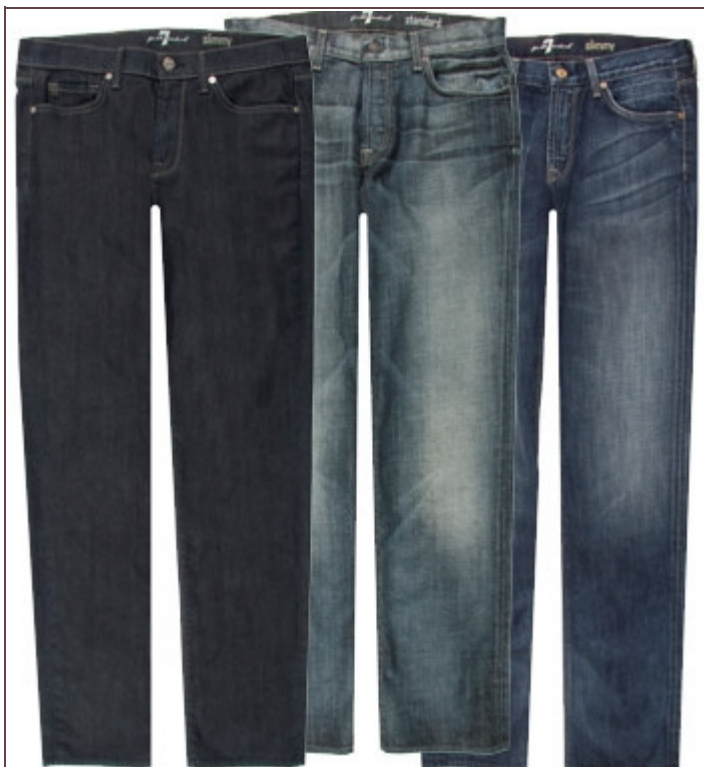
Un jean bien coupé est indémodable et efficace. Jeans Chester, Barrow et Lawrence Ville signés 7 for All Mankind, à partir de 199 euros.