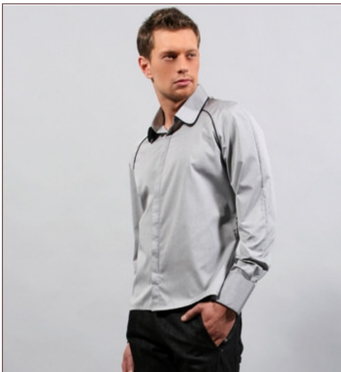
Une belle chemise est une valeur sûre de la garde-robe masculine. Chemise Antoine de François Legendre, 150 euros. © François Legendre