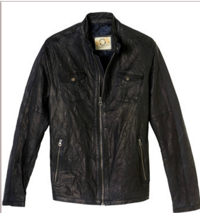
Les femmes aiment le côté canaille du cuir. Veste bleu nuit en cuir perforé, signée Carnet de vol, 249 euros. © Carnet de vol