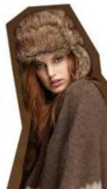
House Of Fraser