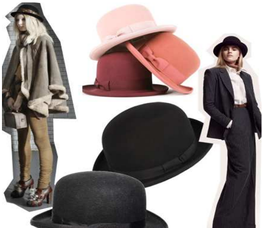
Topshop, Sonia Rykiel, Debenhams, House Of Fraser, H&M