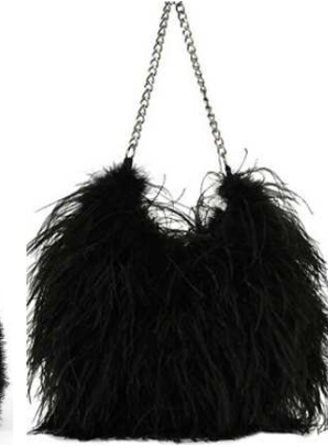
Lock Clutch (Topshop)