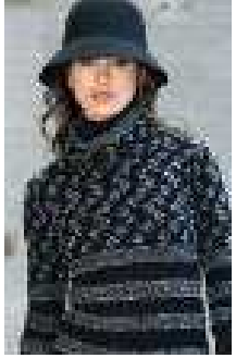
La Fee Maraboutée