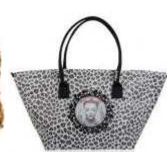
Les Cakes de Bertrand