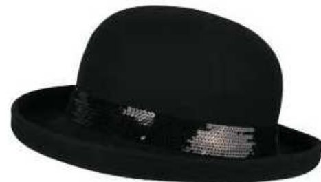
66 Champs Elysées