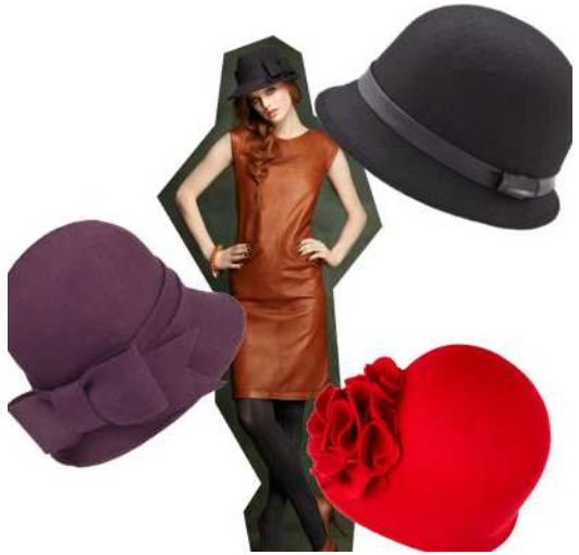
Accessorize, Debenhams, House Of Fraser, Nixon