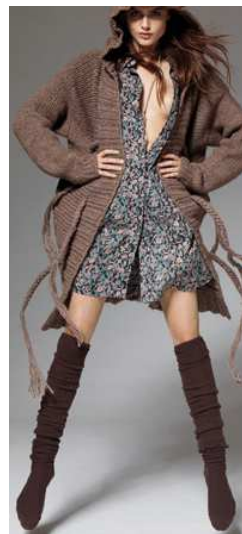
Zadig & Voltaire