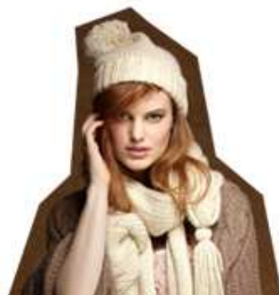
House Of Fraser