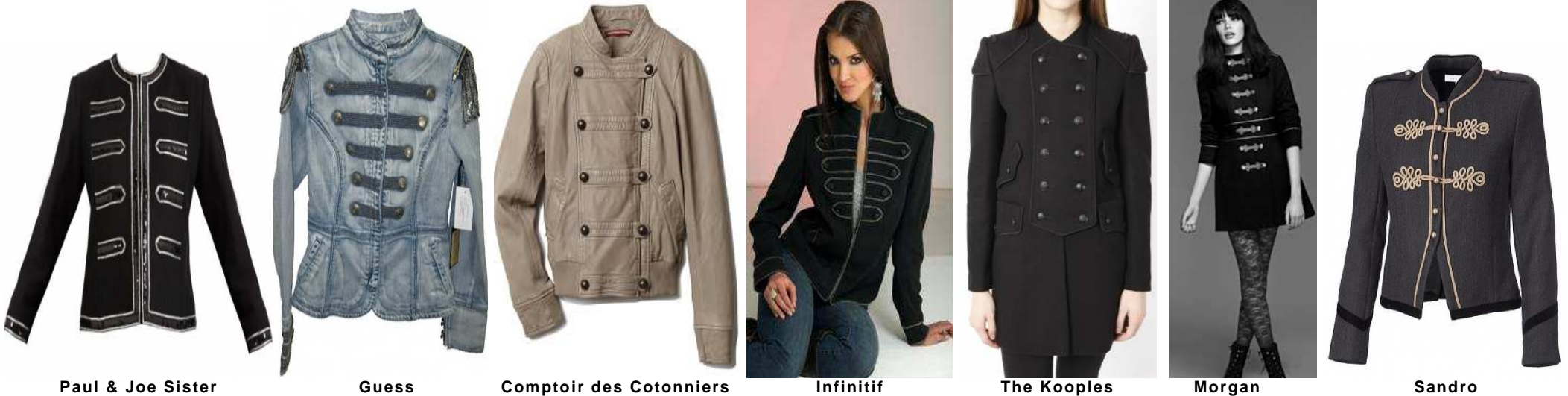
Paul & Joe Sister